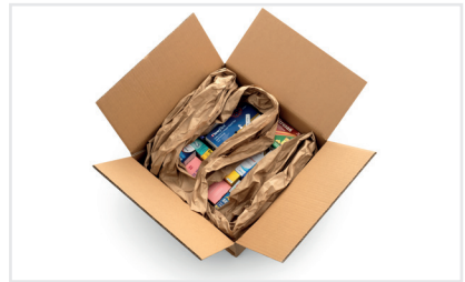
Produktschutz im Versandkarton

Unser Verpackungsmaterial wird aus erneuerbaren und/oder recycelten Ressourcen hergestellt und ist biologisch abbaubar und nach Ende seiner Nutzungsdauer wiederverwertbar.