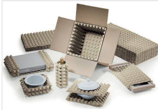
Fasergusspolster Basic + Strong