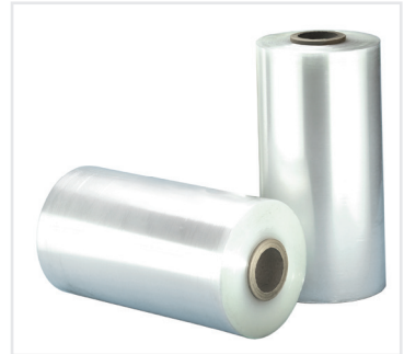
Die recycelte ProfiStretch