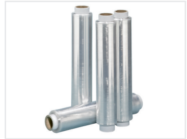
Die recycelte ProfiStretch