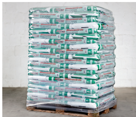
ProfiStretch MB/MBP/MBM, Palettenbild Erde/Torf