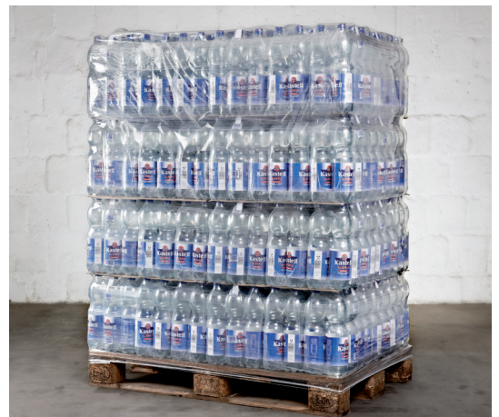
ProfiStretch MCP/MCSP/MCM/MPX/MPHX/ MPSX, Palettenbild Getränkeflaschen