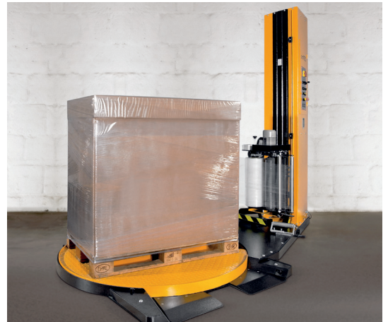
ProfiStretch MC, Standard-Castfolie in Anwendung