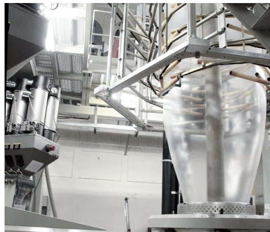
Herstellungsverfahren der Blas-Stretchfolie