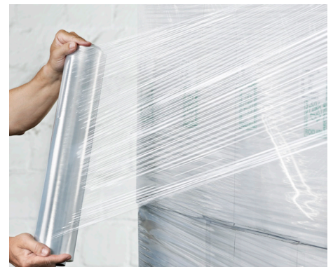
ProfiStretch HC, Standard-Handstretchfolien